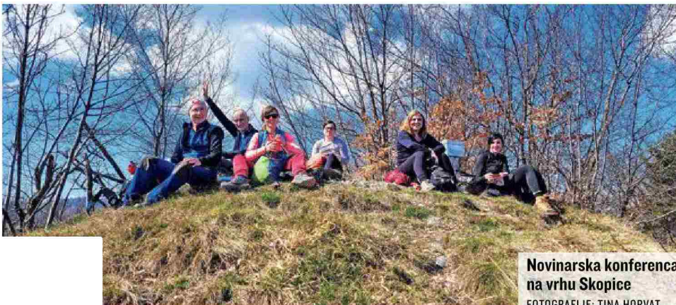
Novinarska konferenca na vrhu Skopice