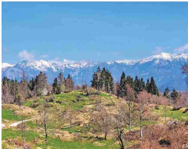
Pogled iz opustelih zaselkov Vrše na Julijce