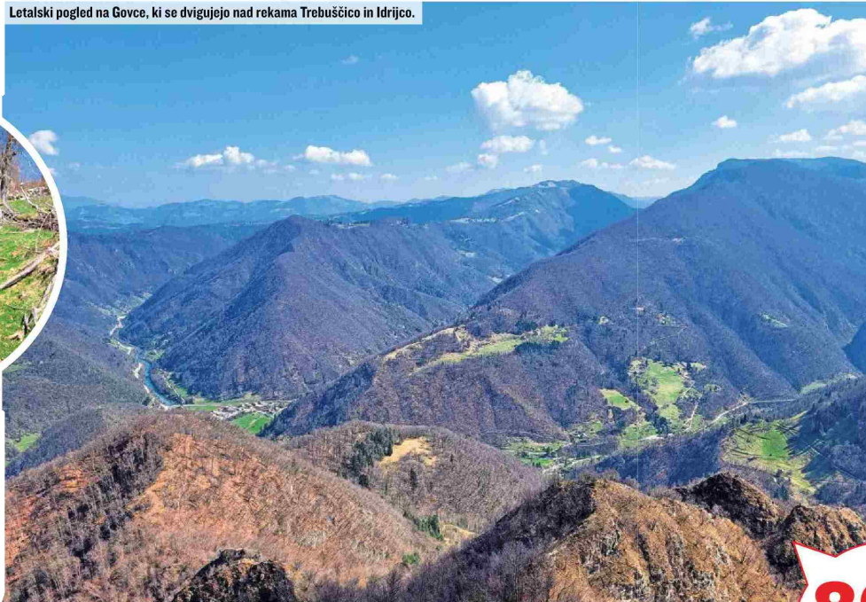
Letalski pogled na Govce, ki se dvigujejo nad rekama Trebuščico in Idrijco.