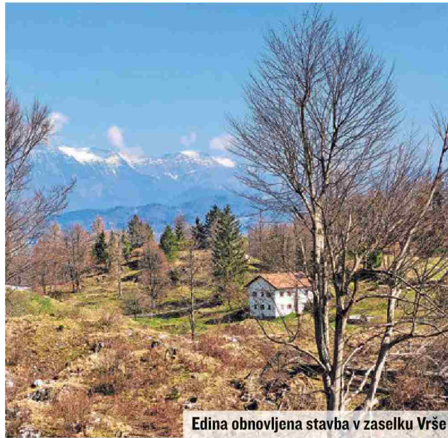
Edina obnovljena stavba v zaselku Vrše